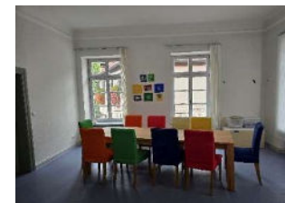
Besprechungsraum ca. 12,9 m 2