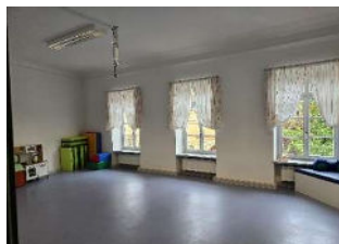
Großer Gruppenraum ca. 38,8 m 2