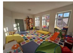
Kleiner Gruppenraum ca. 17,0 m 2